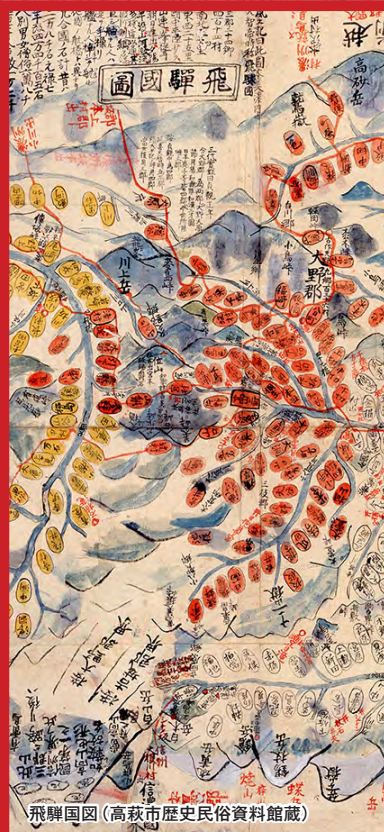
飛騨国図 (高萩市歴史民俗資料館蔵)

[休館日] 土・日・祝 (7月21日・8月4日は開館 (11:00~17:00))