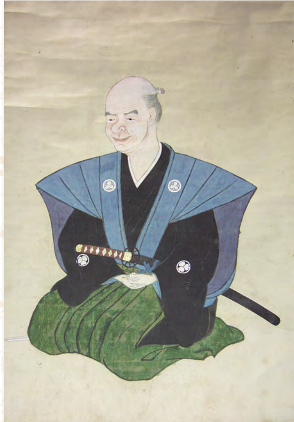
自画像 (高萩市歴史民俗資料館所蔵)