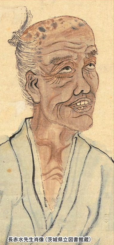
長赤水先生肖像