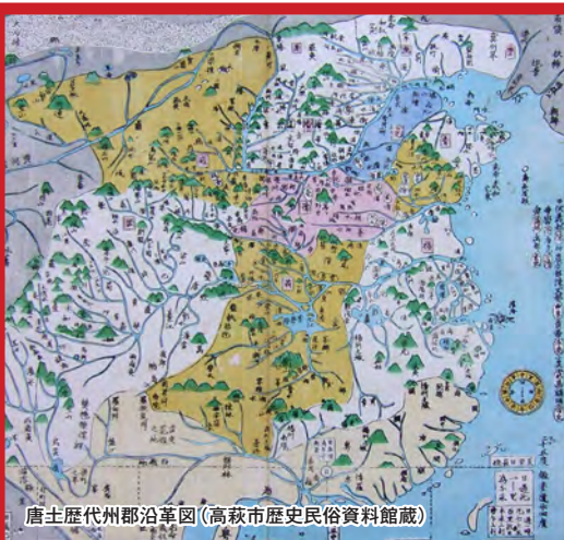
唐土歴代州郡沿革図 (高萩市歴史民俗資料館蔵)