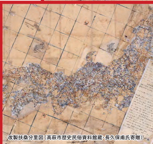
改製扶桑分里図 (高萩市歴史民俗資料館蔵・長久保甫氏寄贈)