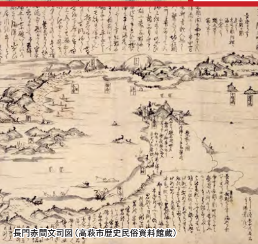
長門赤間文司図 (高萩市歴史民俗資料館蔵)